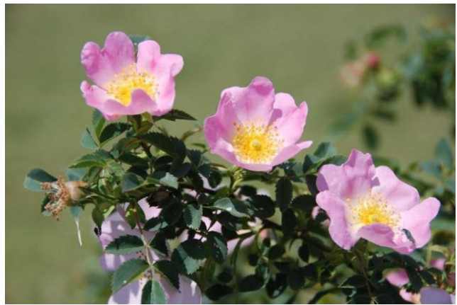
Églantier en pleine floraison

Abondamment arborée, la vallée du Trézon constitue un agréable ruban vert de quelque sept kilomètres, du hameau de l'Étang, à proximité de Péronne, jusqu'à celui de la Durbelière, à l'entrée sur Mazières. Enfin, de beaux arbres isolés parsèment de ci de là la campagne toutlemondaise. Ainsi un magnifique chêne pédonculé en bordure du chemin d'accès à la station d'épuration. Ainsi encore un cerisier sauvage – alias merisier – dans le haut de la prairie au-dessus du stade.