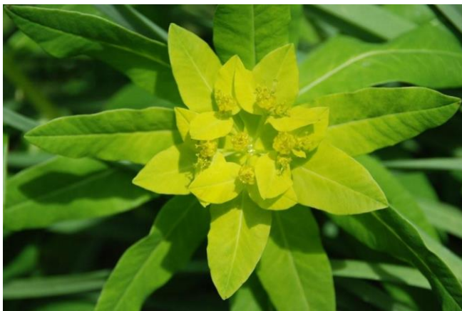
Lumineuse euphorbe d'Irlande au printemps

Côté flore, citons l'orchis tacheté, l'ancolie, l'anémone sylvie, la jacinthe des bois, le solidage verge d'or, la bruyère cendrée, la callune, la fougère aigle, l'euphorbe d'Irlande... Des insectes jusqu'aux grands mammifères en passant par les papillons et les oiseaux, la faune sylvoicole y apparaît également multiple et variée.