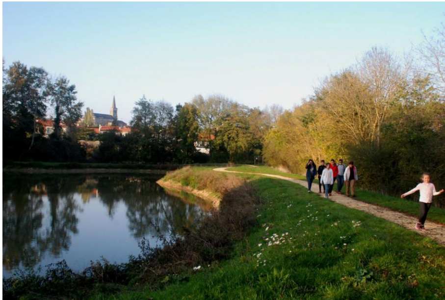
Accessible par la promenade du Trézon, le nouvel étang est vite devenu un lieu de balade en famille

Dans le bas du bourg, les aménagements effectués au fil des ans ont fait des abords du Trézon la principale zone de loisirs de la commune. Aujourd'hui, avec la rivière, le stade, les jeux d'extérieur pour les enfants, le terrain de boules, le coin pique-nique, le sentier piétonnier et l'étang, il y a là vraiment de quoi ravir petits et grands. Avec sa mare, la prairie humide située au-dessus de l'étang abrite quant à elle une flore et une faune emblématiques.