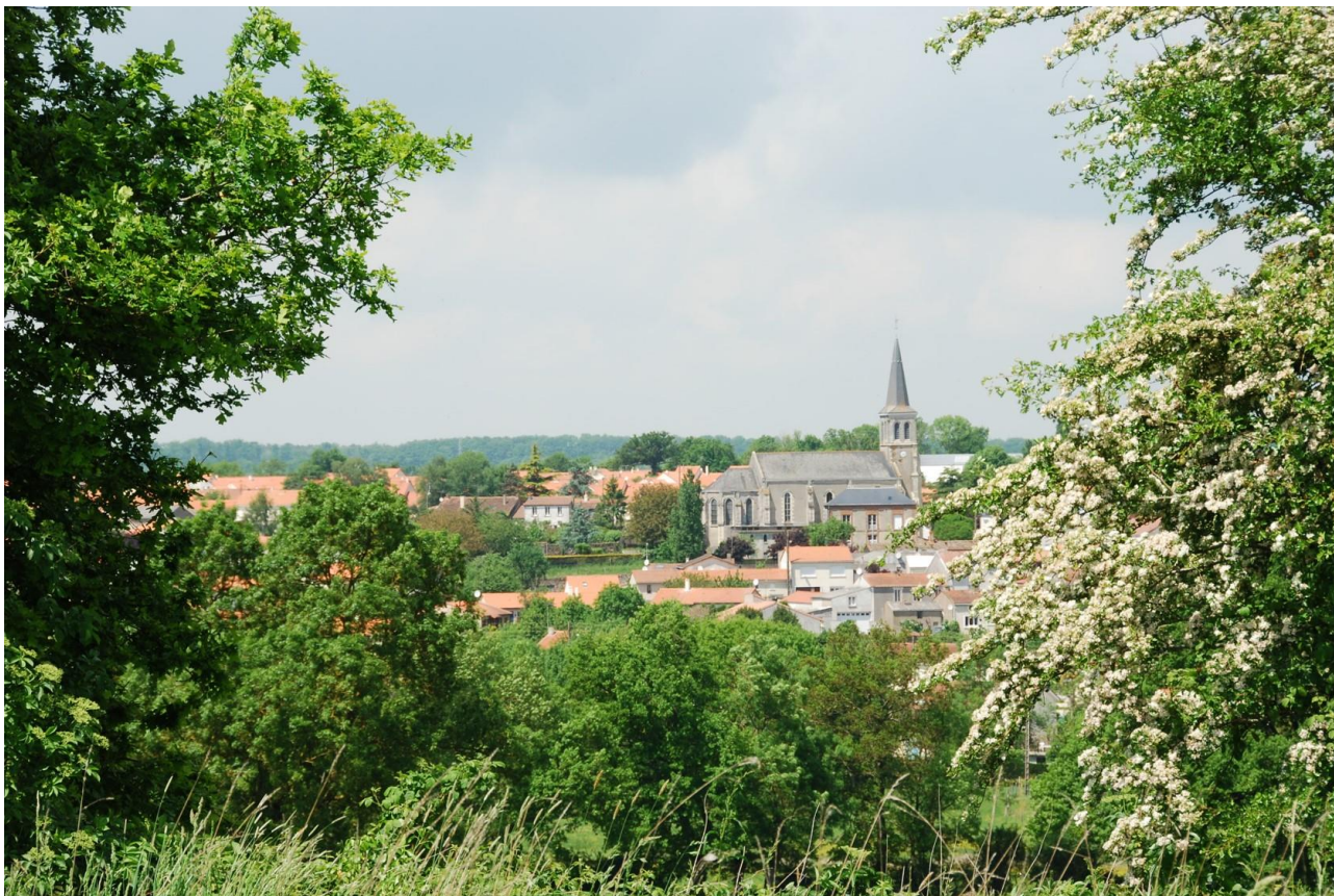
Vu depuis le Puy du Four, le bourg dans son écrin de verdure et d'aubépine en fleurs