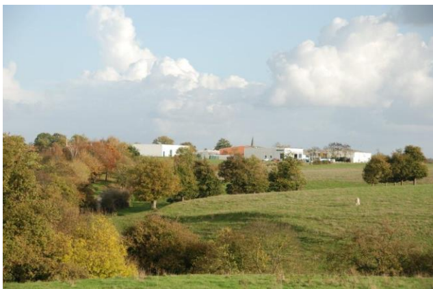
Côté campagne, les coteaux de la Fardellerie