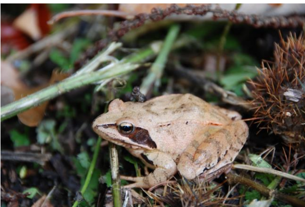
La "grenouille agile" y croise sa consœur verte