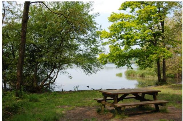
Coin pique-nique à l'étang des Noues