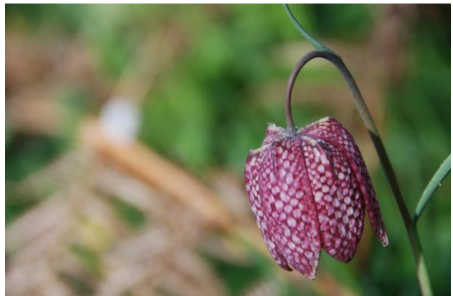
L'élégante "gogane", nom vernaculaire de la fritillaire