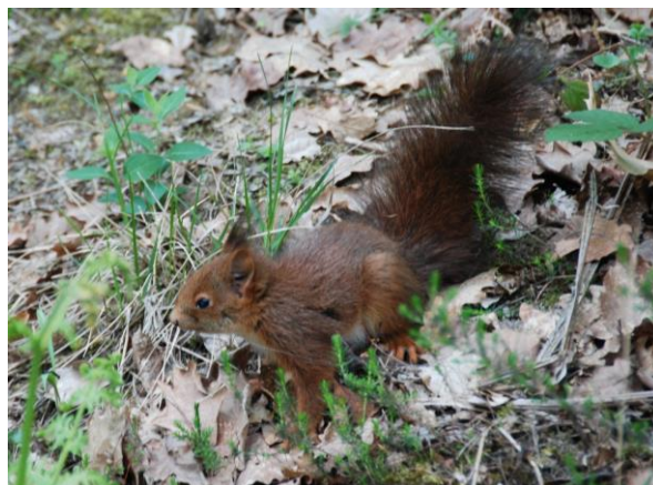
Écureuil vers le carrefour des Quatre Seigneurs