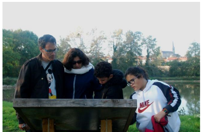
Cinq panneaux didactiques jalonnent le secteur