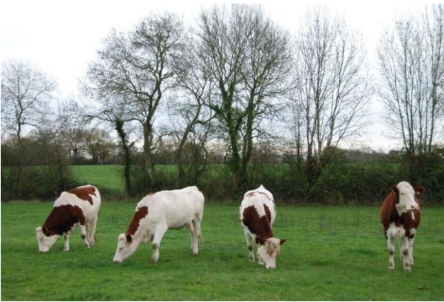
Vaches de race montbéliarde sur fond de haie bocagère

L'agriculture, activité économique majeure sur la commune, s'avère aussi façonneuse de paysage. Les caractéristiques géologiques jointes à un climat plutôt humide ont tout naturellement conduit les exploitants à s'orienter vers l'élevage. Raisonnable et raisonnée, ayant le souci de la qualité, l'agriculture toutlemondaise est une activité vivante, pratiquée avec passion, mais aussi le gage de paysages agréables pour notre environnement quotidien. Le bocage prévaut largement. Dans les haies arbustives le prunellier – alias l'épine noire –, l'églantier, le troène, le roncier, le cornouiller sanguin, le houx fragon abondent. Côté arbres, le chêne pédonculé, le frêne et l'acacia dominant.