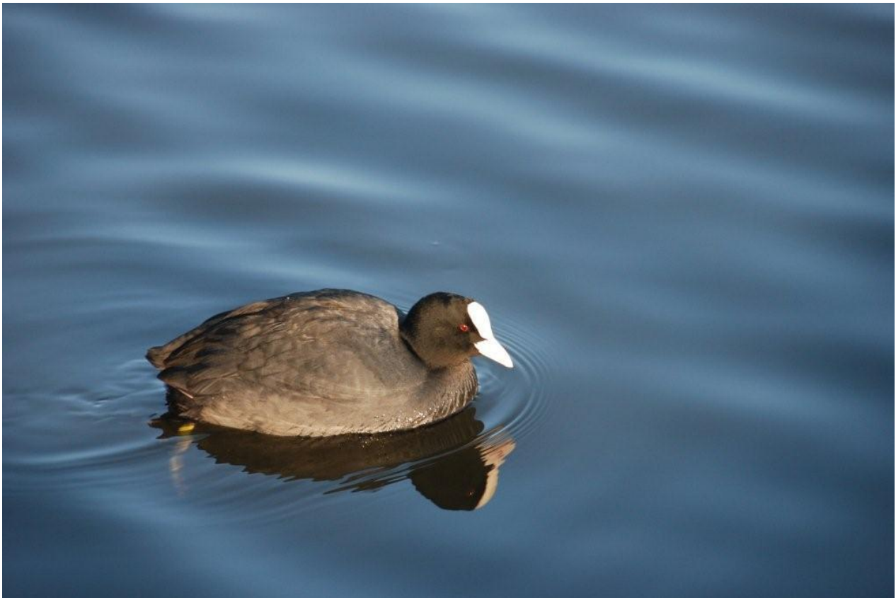
Foulque macroule à l'étang de Péronne

Ce dossier illustré l'aura confirmé : avec sa campagne arborée, sa Zone naturelle d'intérêt écologique, floristique et faunistique de la Challore (ZNIEFF de type 1 répertoriée au niveau régional, [propriété privée]), sa zone de loisirs du Trézon, sa proximité du massif forestier, sa situation entre Ribou, le Verdon, Péronne et Les Noues, notre commune mérite assurément sa devise : « Toutlemonde, un écrin de nature entre lacs et forêts ».