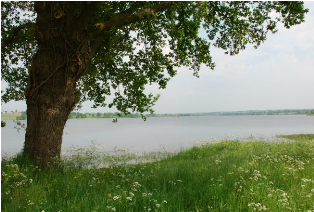
Vue sur le lac du Verdon

Enfin, à deux pas de Toutlemonde, les lacs de Ribou et du Verdon, les étangs de Péronne et des Noues constituent d'agréables lieux de balade et de détente.