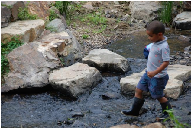
La rivière, très appréciée des enfants l'été