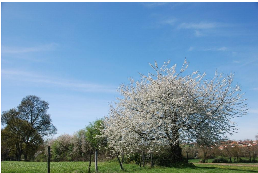
Sur fond de ciel d'azur, un cerisier sauvage de toute beauté

Abondamment arborée, la vallée du Trézon constitue un agréable ruban vert de quelque sept kilomètres, du hameau de l'Étang, à proximité de Péronne, jusqu'à celui de la Durbelière, à l'entrée sur Mazières. Enfin, de beaux arbres isolés parsèment de ci de là la campagne toutlemondaise. Ainsi un magnifique chêne pédonculé en bordure du chemin d'accès à la station d'épuration. Ainsi encore un cerisier sauvage – alias merisier – dans le haut de la prairie au-dessus du stade.