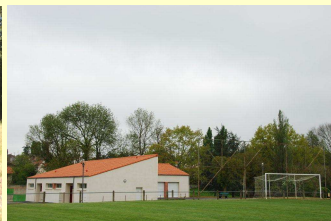
Terrain de foot