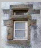
Au détour d'une impasse, une fenêtre peu ordinaire.

Départ Mairie de Toutlemonde Distance 3,4 km Durée 1 h à 2 h... selon le rythme et les arrêts ! Type bitume et sablon Détails sur page suivante