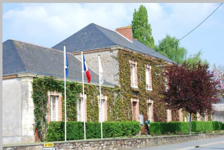
La façade de la mairie, rue Marthe Formon. À l'arrière se trouve le square des 21 otages.