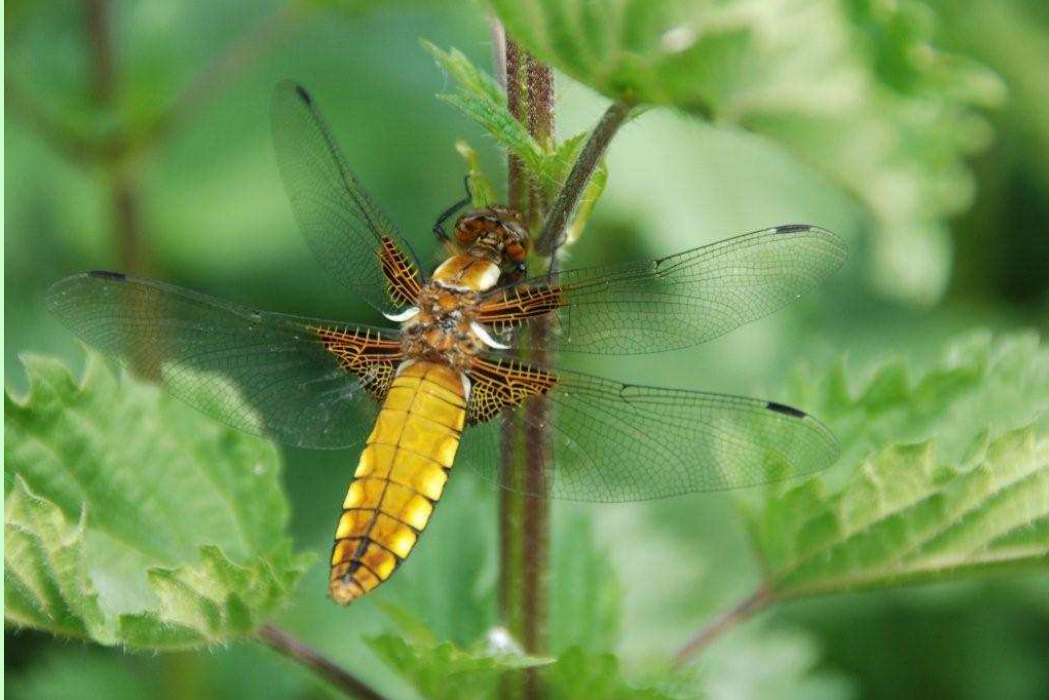
La femelle de la libellule déprimée est de couleur jaunâtre [Photo : Toutlemonde – Rives du Trézon – Mai 2011]

E n avril, vous avez sûrement croisé vos premiers papillons, du genre "Aurores" et "Citrons". Il faut par contre attendre mai pour voir voler les odonates, puisque c'est ainsi que les spécialistes désignent libellules et demoiselles. La " Libellule déprimée " est la plus précoce. Vous la rencontrerez au bord de l'eau. Vous la reconnaîtrez facilement à sa grande taille, à ses taches brunes à la base des ailes, à son corps large et à son abdomen plat. C'est d'ailleurs cette dernière caractéristique qui lui vaut son qualificatif de " déprimée ". L'échantillon ci-dessus a été photographié sur les rives du Trézon, à l'endroit exact où a été édifié depuis le bassin tampon du Pont Ayrault.