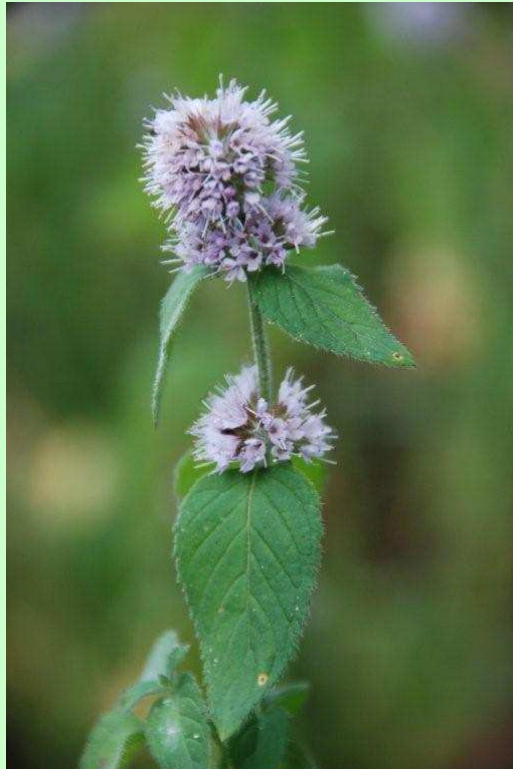
La menthe aquatique se reconnaît aisément à ses têtes florales globuleuses au sommet de la tige [Photo : été 2011]

La menthe aquatique se différencie de ses congénères par sa grosse tête florale arrondie au sommet. Comme toutes les menthes, elle contient de l'huile essentielle qui lui donne cette odeur aromatique si caractéristique. Sa fréquente coloration brun rouille lui a également valu l'appellation de menthe rouge. C'est une espèce qui fréquente les milieux humides. Elle est présente quasiment partout sur la commune dans les fossés des bords de route. Nous l'avons toutefois rencontrée avec une abondance particulière route de Chanteloup et route de Nuillé.