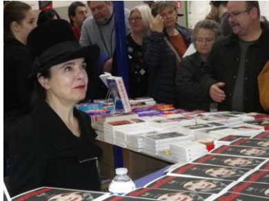
Amélie Nothomb « Soif »