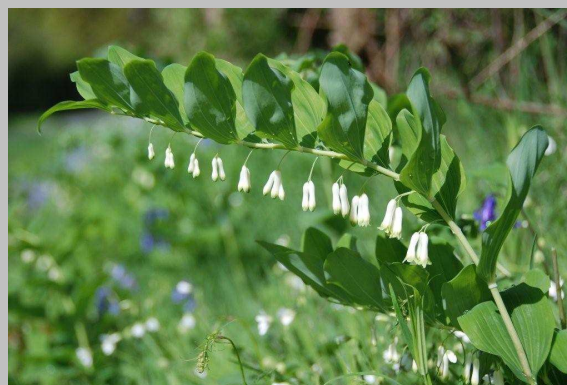
Le muguet multiflore, ou sceau de Salomon.