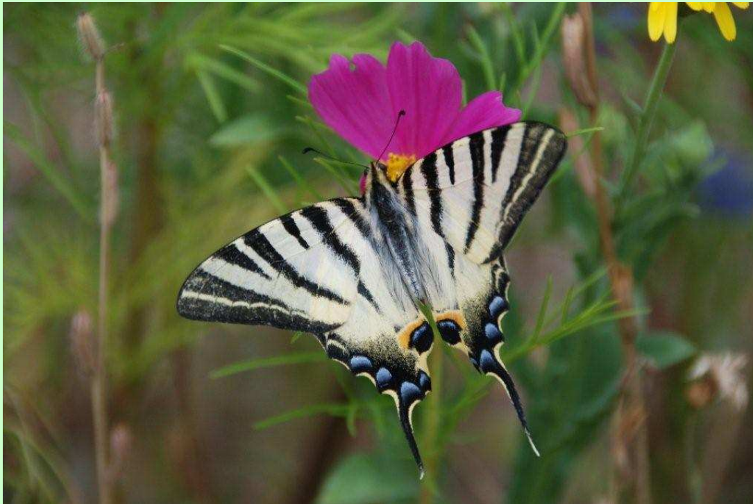
Le flambé est l'un des plus beaux papillons de nos régions [Photo : été 2010 – Les Tilleuls]

Rares sont les papillons que l'on peut identifier facilement. Avec son vol plané, ses ailes blanc jaune rayées de noir et rehaussées de bleu, et surtout ses longues queues caractéristiques, le flambé échappe à la règle et se reconnaît assez aisément. La seule confusion possible est avec le machaon, un proche parent, fort joli, également porteur d'une longue queue noirâtre, mais aux dessins sur les ailes plus élaborés. La chenille du flambé fréquente les prunelliers, celle du machaon est plutôt hôte du fenouil et de la carotte sauvage. Flambés et machaons sont deux espèces estivales, aux allures de bijoux exotiques, que l'on peut rencontrer sur le territoire de la commune.