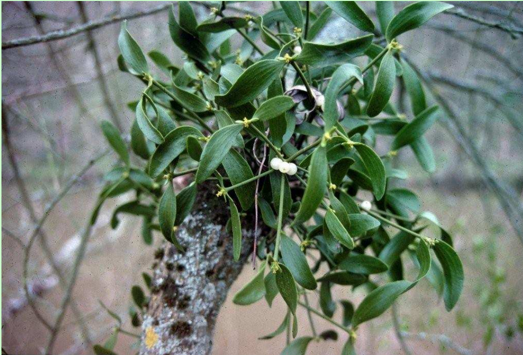
Touffe de gui en fruits

C urieux végétal que cet arbrisseau ligneux, aux feuilles coriaces, aux fruits constitués de petites boules blanches translucides remplies d'une pulpe gélatineuse gluante, qui se développe en touffes vert mat ou jaunâtres sur certaines espèces d'arbres. Le pommier et le peuplier sont ses hôtes privilégiés. Dépourvu de racines, le gui est un semi parasite qui se nourrit de la sève de son père nourricier grâce à un ou plusieurs suçoirs. Très rare, le gui du chêne était l'objet d'une vénération religieuse chez les peuples celtiques autrefois. Le symbolisme est resté très fort et le cri de "Au gui l'an neuf !" a été utilisé jusqu'au XVII e siècle. En Angleterre d'ailleurs, le gui de Noël et du jour de l'An reste une tradition bien ancrée.