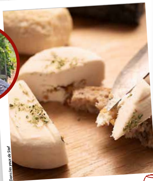
Dans les yeux de Stief

Les Mazeries à Yzernay Tél. : 02 41 55 07 37 contact@leroume.fr