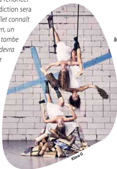
Mad in Finland convoque le folklore finlandais, la mélancolie et la folie, mais aussi des faits marquants tirés des livres d'Histoire.

numéros à la technique éblouissante, de l'antipodisme à l'art du clown en passant par la danse sur fil et l'acrobatie aérienne. De la prouesse circassienne, de l'humour et de la musique pour raconter une Finlande imaginaire et réinventée, où la « dépression finlandaise » a quelque chose de magique et où la rudesse du climat forge des tempéraments bien trempés.