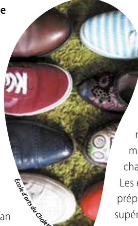
Ecole d'arts du Choletais

D'une paire de chopines disposée au pied des Époux Arnolfini , œuvre peinte par l'artiste primitif Jan Van Eyck, aux escarpins Marilyn , création gigantesque réalisée en casseroles par l'artiste Joana Vasconcelos, en passant par Pour mieux rebondir , souliers à ressorts de Pierre Ardouvin, la chaussure traverse l'histoire de l'art. Ainsi, escarpins, baskets, claquettes, sandales, souliers, sabots, charentaises s'en donnent à pleines semelles de vent : objet usuel,