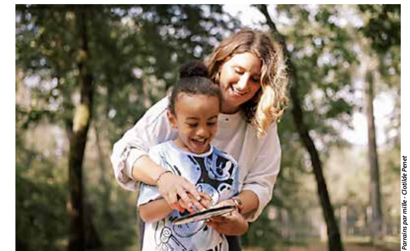
Le parrain ou la marraine devient une personne de référence pour l'enfant ou le jeune.

Depuis 1990, l'association Parrains par mille offre à des enfants ou jeunes en difficulté la possibilité de sortir de l'isolement et s'ouvrir aux autres, grâce à des marraines et parrains, attachés à les aider à grandir et préparer leur avenir sereinement. Cuisiner, dessiner, se promener, jouer au football ou au basket, faire du vélo, regarder un film, s'amuser avec des jeux de société, lire, visiter un musée, écouter de la musique... : toutes les activités sont bonnes à partager, selon les centres d'intérêt de chacun, pour favoriser cet épanouissement et l'autonomie des enfants, dès 3 ans. « Les rencontres régulières, en moyenne deux par mois, sont une bulle d'oxygène pour eux, afin qu'ils puissent renforcer un capital culturel, développer la connaissance d'eux-mêmes et retrouver la confiance qu'ils ont souvent perdue, qu'ils vivent dans leurs familles ou dans des structures spécialisées. Nous travaillons en partenariat avec la Protection de l'enfance et les maisons de