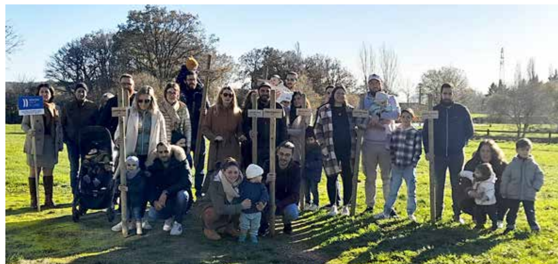
Mairie de La Plaine

Lors de la première cérémonie Une naissance, un arbre proposée par la Municipalité, en collaboration avec la Région Pays de la Loire, neuf familles d'enfants nés en 2022 sont venues planter leur arbre, à la base de loisirs de la Nongille. Ce moment a été très apprécié des parents, qui vont désormais voir grandir le chêne symboliquement associé à leur enfant en même temps que lui.