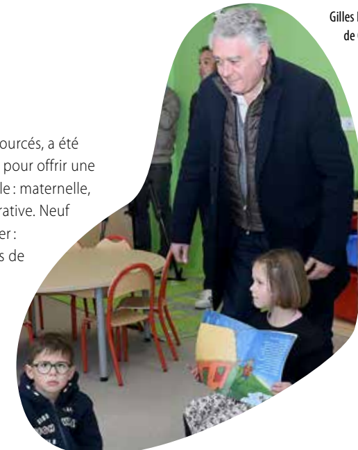
Gilles Bourdouleix, maire de Cholet, a rencontré les enfants lors de l'inauguration du nouvel espace de l'accueil de loisirs.

796 000 € pour la piscine, les vestiaires et sanitaires et 520 000 € pour les aménagements extérieurs. La Caisse d'allocations familiales de Maine-et-Loire a participé au financement de ce projet, à hauteur de 343 000 €; l'État pour 118 962 € au titre de la dotation de soutien à l'investissement local, et le Département à hauteur de 19 257 € pour l'entretien des routes départementales.