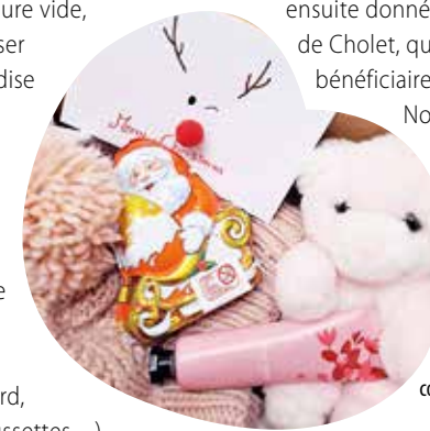
Les boîtes doivent être composées de cinq éléments.

d'emballer joliment le tout ! À Cholet, jusqu'au mercredi 20 décembre, la boulangerie l'Ami du pain et la maison de la presse Chez Nana s'associent pour collecter ces paquets cadeaux, sur lesquels il convient de préciser s'ils s'adressent plutôt à une femme, un homme ou un enfant. Ces belles attentions seront ensuite données au Secours populaire de Cholet, qui les distribuera à ses bénéficiaires lors d'un goûter de Noël avec son fameux Père Noël vert. L'an dernier, 250 boîtes avaient fait le bonheur d'autant de personnes démunies.