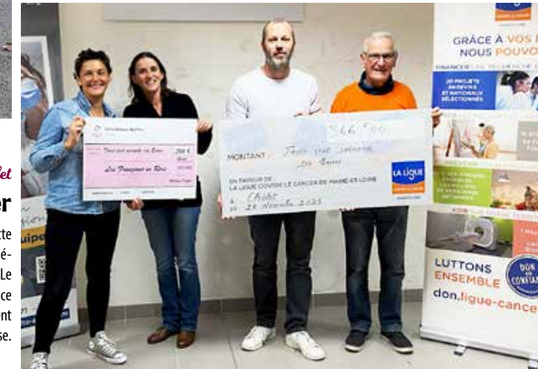
Polyclinique du Parc

En guise de conclusion à la mobilisation pour Octobre rose pour la lutte contre le cancer du sein, la polyclinique du Parc a reversé le fruit du ciné-débat organisé début octobre, autour du film MaMa , de Julio Medem. Le cinéma CGR, hôte de l'événement, s'était engagé à reverser 1 € par place achetée, abondé par la polyclinique. Ainsi, deux associations se partagent 732 € : la Ligue contre le cancer de Maine-et-Loire et les Frangines en rose.