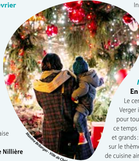
Maxime Bellanger - Ville de Cholet

Marché de Noël La Maison Gaborit organise un marché de Noël avec 12 producteurs bio et artisans locaux : peluches, bijoux, maroquinerie, laine, décorations, fromages, chocolats, confitures, café, etc. Un vin chaud solidaire sera proposé au profit de l'association choletaise Après l'envol. 15 h à 20 h, la Grande Nillière