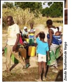
Toutlemonde en chœur chantera au profit de Zoodo Toutlemonde Yargo.

de l'eau aux habitants et quelques cultures. Un choix d'investissement des villageois eux-mêmes. Aider ces Burkinabés, tout en faisant plaisir à ses oreilles, c'est donc l'invitation de la Culture vous veut du bien. Comme d'habitude, l'entrée est gratuite pour ce concert au répertoire varié – des chants contemporains jusqu'au negro-spiritual, en passant par des mélodies populaires, entre autres – et les spectateurs sont libres de donner à la sortie!