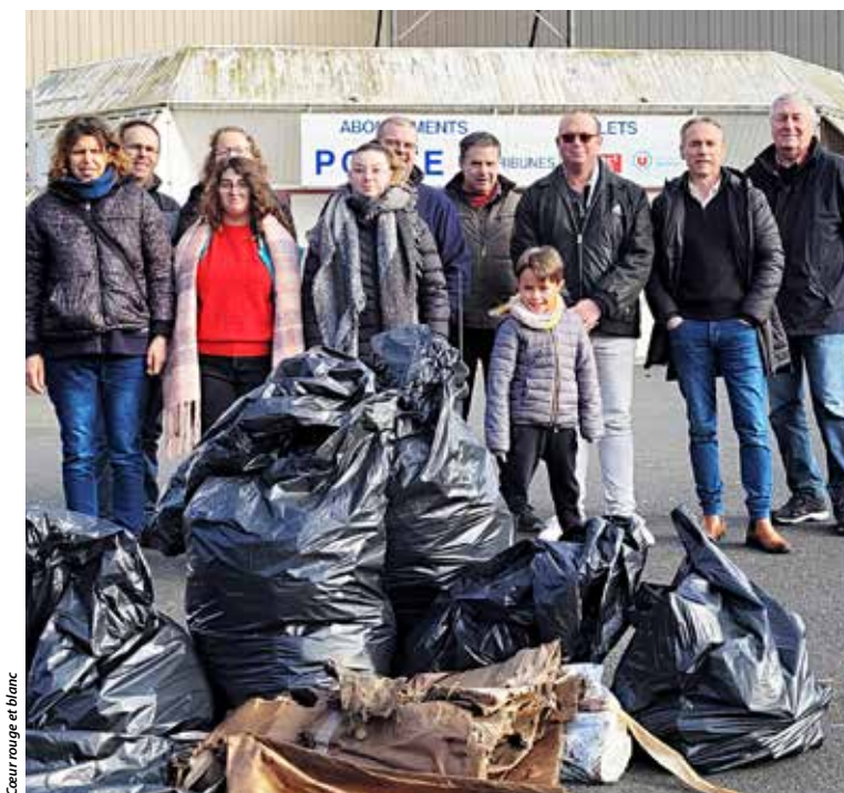
Cœur rouge et blanc

Une douzaine de membres actifs de Cœur rouge et blanc, l'association des supporters actionnaires de Cholet Basket (CB), se sont retrouvés à la Meilleraie pour une opération de nettoyage des abords de la salle. Pas moins de 50 kg de déchets ont été ramassés, dont une centaine de bouteilles en verre, dans les haies, le parc et les fossés bordant le parking et la salle où joue CB. Un butin qui appelle chacun à faire preuve de respect pour l'espace public.