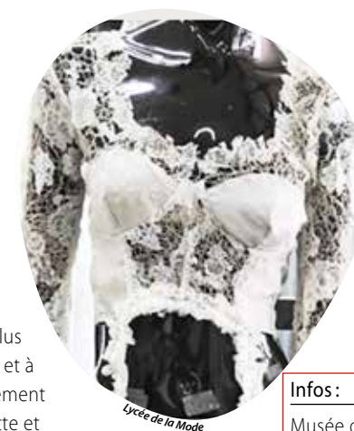
Lycée de la Mode

femmes à délaisser le soutien-gorge, à choisir des sous-vêtements plus confortables et à ne plus forcément assortir culotte et soutien-gorge. Des visites guidées sans réservation