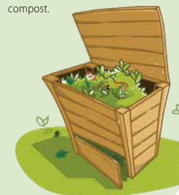
Ville de Cholet

devez vous procurer des vers de terre et réaliser quelques manipulations pour le démarrage. En digérant les déchets, ils transforment la matière en lombricompost et lombrithé qui peuvent être utilisés pour nourrir les plantes d'intérieur et les jardinières, • mettre en place un composteur partagé entre voisins, quand il y a des espaces verts en commun, • utiliser un seau à bokashi (sorte de composteur de cuisine, dont le mot d'origine japonaise signifie matière organique fermentée) pour stocker ses aliments plusieurs semaines dans sa cuisine. Néanmoins, il faudra ensuite vider son seau dans un composteur partagé. Retrouvez dans les prochains Synergences hebdo les réponses à d'autres idées reçues autour du compost.