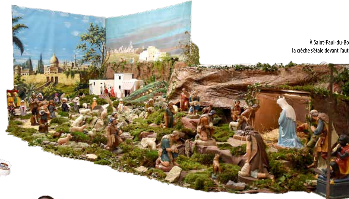
À Saint-Paul-du-Bois, la crèche s'étale devant l'autel.

À Trémentines, la mousse et les branchages cèdent la place au papier crèche. Adroitement froissé, celui-ci compose entièrement le décor, au point de donner l'illusion d'un paysage taillé dans le rocher. L'étable de la Nativité y est d'ailleurs remplacée