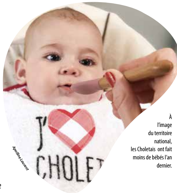
  l'image du territoire national, les Choletais ont fait moins de b b s l'an dernier.

du Stationnement. En moyenne, le d lai d'attente pour un rendez-vous a  t  divis  par deux, soit 45 jours ouvrables aujourd'hui. » Le fait que les communes du May-sur- vre, Maul vrier et La S guini re aient suivi les pr conisations pr fectorales en ouvrant un service d'instruction des titres d'identit  semble avoir contribu    soulager les personnels choletais, au nombre de 15   l' tat civil, dont trois pour les seuls titres d'identit . « L'activit  de ce service est optimis e et optimale » souligne l' lu.