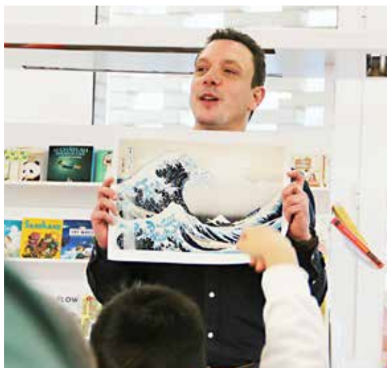
Mairie de Lys-Haut-Layon