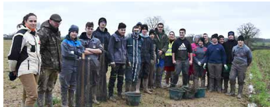
Une vingtaine d'élèves de la MFR de Montreuil-Bellay a participé à ces plantations.