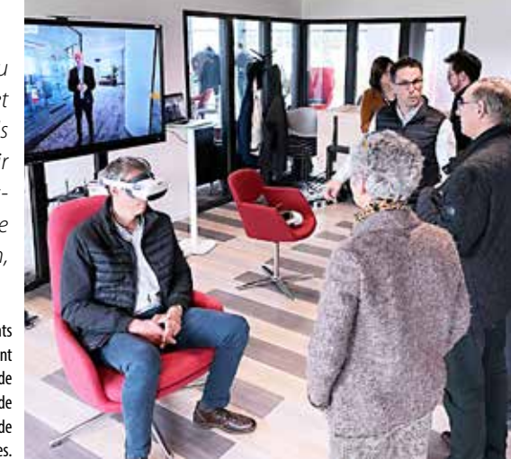
La Filature numérique