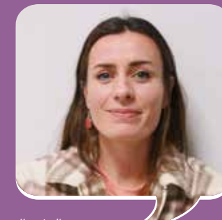
« J'essaie d'apporter ma positivité dans l'exercice de mon métier. »