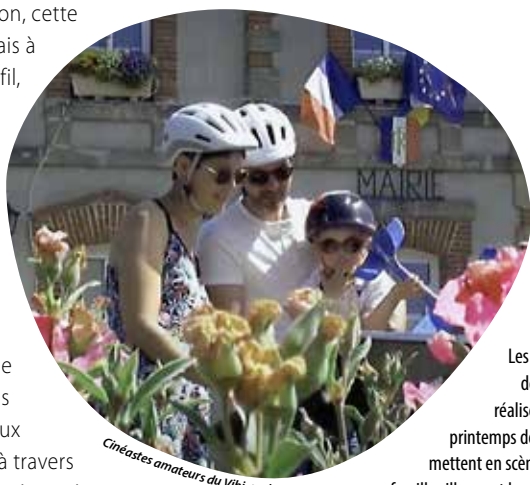
Cin astes amateurs du Vihiersois

La commune de Lys-Haut-Layon pr sente la vid o Balade en Lys-Haut-Layon , r alis e   sa demande par le club des Cin astes amateurs du Vihiersois. D voil e en avant-premi re en novembre dernier lors du gala de l'association, cette vid o est d sormais   retrouver au Cin fil, avant chaque projection, ainsi que sur YouTube. En 4'16, elle montre les particularit s des neuf communes d l gu es, valorise les charmes lyssois et pr sente les lieux incontournables,   travers des images printani res o  se d gage douceur de vivre et bonne humeur. « Cet outil a vocation   pr senter notre territoire aupr s des autres collectivit s, des entreprises et   s duire de potentiels nouveaux »