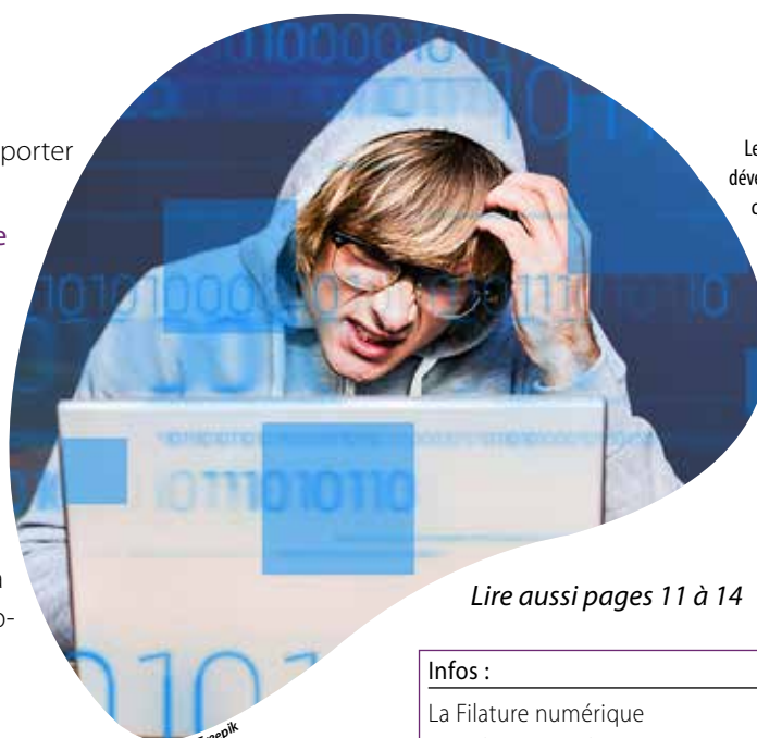
Le No-Code est un mode de développement qui occulte la complexité du code source de l'application.

Les participants doivent apporter leur ordinateur portable. > Conférence : La création de sites avec Webflow Mardi 20 février, 12h* Vous aspirez à concevoir des sites web époustouffants, mais la complexité du processus vous semble décourageante ? Cette conférence sur Webflow, le logiciel révolutionnaire, ouvre la voie à la création de sites web exceptionnels sans compromis. > Projection afterwork : Révolution No-Code Vendredi 23 février, 18h30 Le documentaire réalisé par Stanislas Verjus-Lisfran invite à explorer l'univers No-Code à travers les portraits de personnes qui, chaque jour, le font, créent ou le démocratisent.