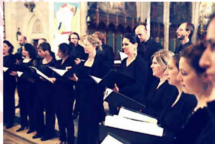
Seguido est composé d'environ 25 chanteurs de diverses régions de France.

L'ensemble vocal Seguido présente son nouveau programme le dimanche 11 février, à 16 h 30, en l'église du Sacré-Cœur. Intitulé 6 secondes 29 , il est destiné à être interprété dans des lieux à l'acoustique réverbérante. « À quel moment commence un son ? Quand se termine-t-il ? Quelle est sa durée de vie, au-delà de la métrique d'une rythmique et le graphique d'une partition ? » Seguido, en résidence à Sablé-sur-Sarthe, est dirigé par Valérie Fayet, également chef de chœur de l'Orchestre national des Pays de la Loire et professeur au conservatoire de Nantes.