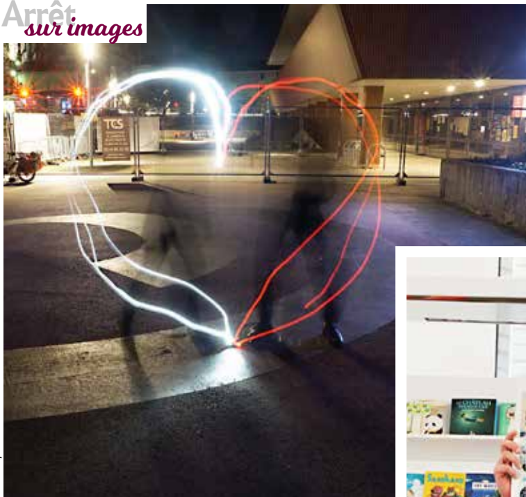
Médiathèque Élie Chamard

Vendredi 19 janvier - Cholet et samedi 20 janvier - Lys-Haut-Layon/Vihiers