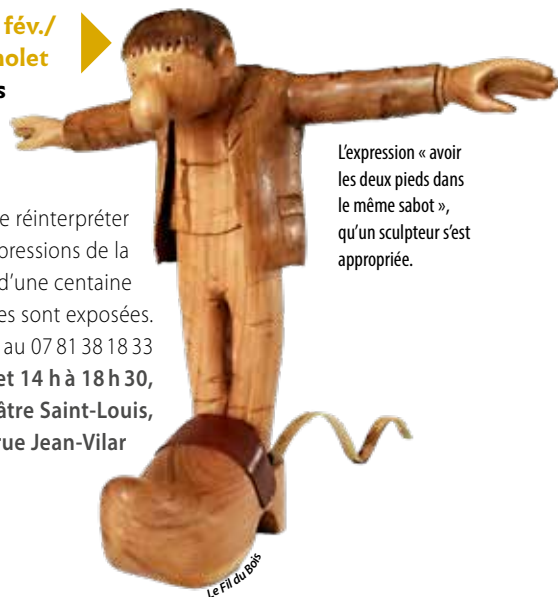
L'expression « avoir les deux pieds dans le même sabot », qu'un sculpteur s'est appropriée.

L'atelier du centre social Pasteur, le Fil du bois, a choisi de réinterpréter en sculptures les expressions de la langue française. Plus d'une centaine de pièces sont exposées. Infos au 07 81 38 18 33 10 h 30 à 12 h et 14 h à 18 h 30, du mar. au ven., théâtre Saint-Louis, galerie, rue Jean-Vilar