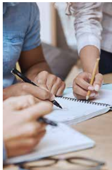
Rédiger le projet associatif est une étape cruciale dans le développement d'une association.

Les vertus de l'opération – dont le coût, de 5 € du plant, est entièrement pris en charge par la Région des Pays de la Loire – ne s'arrêtent pas là, puisque les actions de recépage (coupe périodique des arbres pour favoriser les nouvelles pousses) alimentent la filière bois.