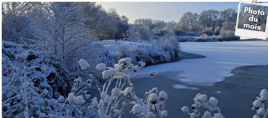
L'étang sous la neige