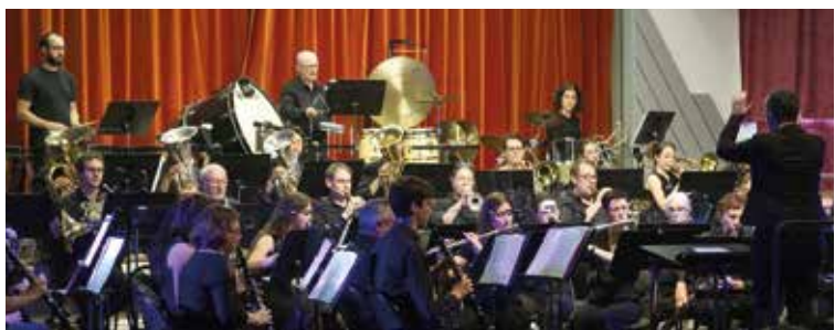
L'orchestre d'harmonie de Maulévrier.

www.harmonieamaulevrier.com ou helloasso Tarifs: 10 €, 6 € réduit, gratuit moins de 10 ans