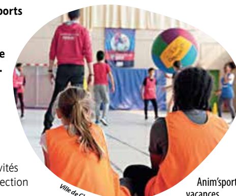
Anim'sports vacances revient en avril...

La seconde semaine, ce sont les éducateurs des clubs partenaires qui prendront le relais, sur plusieurs sites, selon les activités: hockey sur glace, judo, tennis de table, cirque, patinage, badminton, tennis, tir à l'arc,