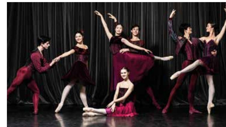
Le Junior ballet

En mai 2024, l'Opéra national de Paris annonçait la création de son Junior ballet. Cette nouvelle compagnie est constituée de jeunes artistes âgés de 18 à 23 ans, engagés pour une durée de deux ans en contrat de professionnalisation. Conçue comme une pépinière de jeunes talents, elle répond à plusieurs enjeux: diversifier les profils des danseurs, favoriser leur insertion professionnelle, renforcer l'ouverture au public grâce à des tournées et actions de médiation, tout en perpétuant le savoir-faire tricentenaire de l'Opéra de Paris. Le