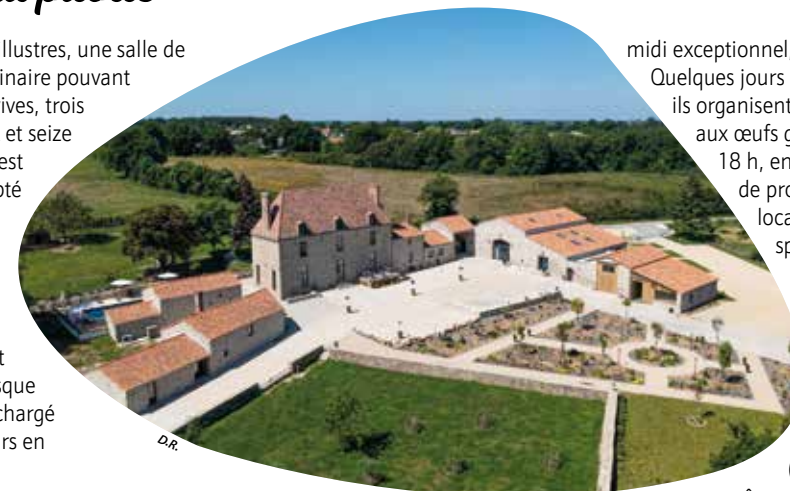
L'ancien prieuré de la Haye a été entièrement réhabilité pour en faire un gîte d'exception.

Des pierres tombales, notamment celle d'un enfant avec une inscription en latin ainsi que celle d'un chevalier de la famille de Mayré, ont été retrouvées et insérées en façade. Un autre bloc de granit, gravé de l'année 1764, prouve un premier remaniement de la bâtisse, juste avant les Guerres de Vendée, dont elle fut un quartier général, en surplomb du bocage. De