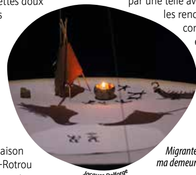
Migrante est ma demeure

savoirs, du partage de vie et de rires. En somme, ce que les porteurs du projet l'Oasis de l'association EcoHabilie voudraient vivre dans leur futur habitat participatif, à Cholet. Cette soirée est une invitation aux personnes curieuses ou intéressées par une telle aventure à venir