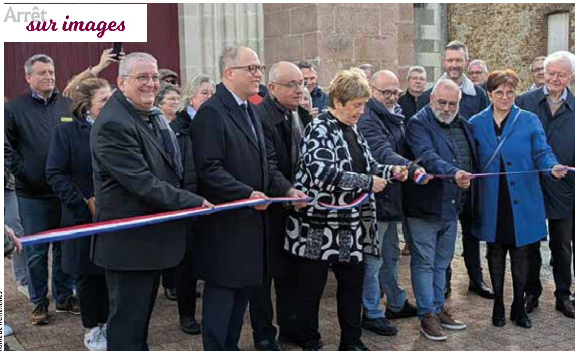
Mairie de Trémentines