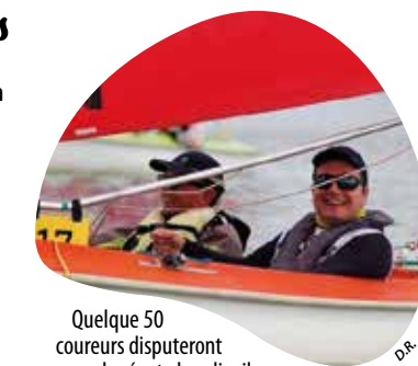
Quelque 50 coureurs disputeront la régates handivoile.

Engagée depuis 2016 dans l'inclusion des personnes en situation de handicap, l'Association des régates choletaises accueille pour la quatrième fois une étape du championnat de ligue handivoile, ce dimanche 29 mars. De 10 h à 16 h, une cinquantaine de coureurs des Pays de la Loire et régions limitrophes, parmi lesquels des équipages locaux, en découvriront sur le lac de Ribou. Pendant l'épreuve, chacun tentera de se qualifier pour les championnats de France, en solitaire sur des mini J, réductions à l'échelle 1/7 e des bateaux qui disputaient la coupe de l'America dans les années 80, ou en duo avec une personne valide, sur les Hansa 3.3, dériveurs très sécurisants adaptés aux