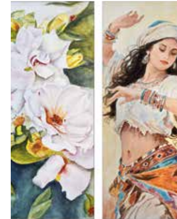
L'exposition montre la variété des aquarelles réalisées au sein de l'atelier.

Infos: 16 rue de la Rochefoucauld à Cholet Entrée libre et gratuite