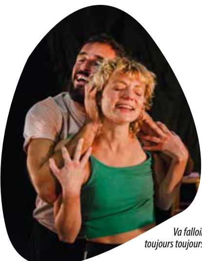
Va falloir toujours toujours

L'espace culturel Senghor reçoit la compagnie la Parenthèse et le Petit théâtre de Sherbrook, pour Va falloir toujours toujours, un spectacle de danse à voir en famille . Proposé le dimanche 29 mars, à 15 h, il sera accompagné d'un goûter.