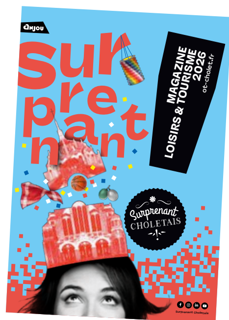
Les patrimoines sont à l'honneur dans le magazine Loisirs et Tourisme 2026.