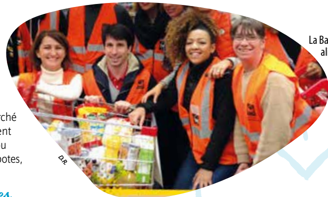
La Banque alimentaire a besoin de vous !

Afin de participer au succès de cette opération, la Banque alimentaire en appelle aussi aux volontaires qui voudraient bien donner un peu de leur temps. « Nous avons besoin de 300 à 350 personnes pour assurer les permanences. Des fidèles nous rejoignent à chaque collecte, ainsi que des collégiens, lycéens, étudiants, salariés en mécénat de compétences, compagnons du devoir, etc., mais