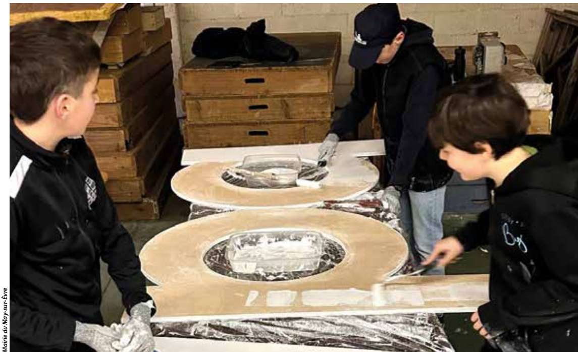
Mairie du May-sur-Eure

Les Grands prix nationaux de musique, organisés par l'Énergie musique, se tiendront du vendredi 22 au dimanche 24 mai dans la commune. Pendant leur première semaine de vacances, des adolescents se sont investis avec enthousiasme et créativité pour préparer ce week-end, pour lequel 10 000 visiteurs sont attendus. Dans le cadre d'un chantier jeunes, ils ont peint des supports qui guideront le public et réalisés différentes décorations qui contribueront à la réussite de ce grand rendez-vous !