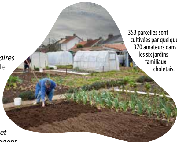
353 parcelles sont cultivées par quelque 370 amateurs dans les six jardins familiaux choletais.