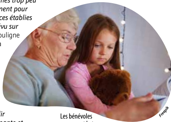
Les bénévoles consacrent le temps qu'elles veulent à l'association.