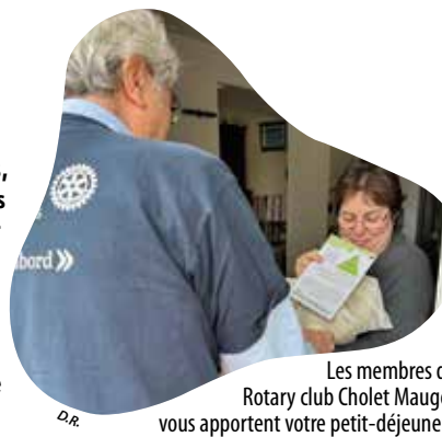
Les membres du Rotary club Cholet Mauges vous apportent votre petit-déjeuner !

Et si savourer un délicieux petit-déjeuner devenait un véritable geste de solidarité? C'est possible avec le Rotary club Cholet Mauges, qui réitère son opération des P'tits dej de l'espoir, destinée à soutenir les enfants atteints de cancer et leur famille, durement éprouvés par la maladie. Le dimanche 29 mars, dès les premières heures du jour, les membres du club service se mobiliseront pour préparer avec soin ces repas gourmands, avant d'en assurer la livraison à domicile à Cholet et dans les communes voisines, entre 8 h et 9 h pour les plus matinaux ou entre 9 h et 10 h. Arriveront ainsi chez vous des produits de qualité, adaptés à tous les âges, pour allier plaisir, partage et générosité. Les adultes pourront se régaler avec un croissant, un petit pain et un yaourt nature de partenaires locaux, mais aussi de la confiture, un jus d'orange et une pomme. Les enfants apprécieront un pain aux pépites de chocolat, une gourde de compote, un jus d'orange et un lait chocolaté.