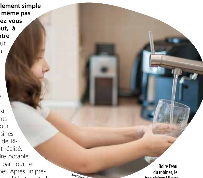
Boire l'eau du robinet, le bon réflexe ! Il n'en coûte que 2,60 € par an par personne.

Autre atout non négligeable, l'absence de bouteilles permet une économie de 10 kg de plastique par habitant chaque année, mais aussi moins d'émissions de gaz à effet de serre, étant donné qu'aucun véhicule n'est nécessaire pour transporter des packs d'eau de l'usine jusqu'au magasin, puis du magasin jusque chez nous. Notre eau est également recyclée localement, dans l'une des neuf sta-