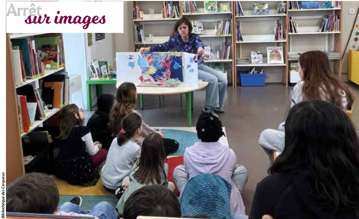
Bibliothèque des Cerqueux